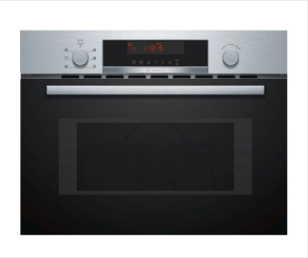
Combi-oven Inhoud 44 liter, LCD display, Cleaning Assistancefunctie, snel verwarmen