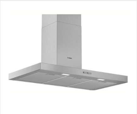
Schouwkap Druktoets bediening, recirculatie, LED verlichting