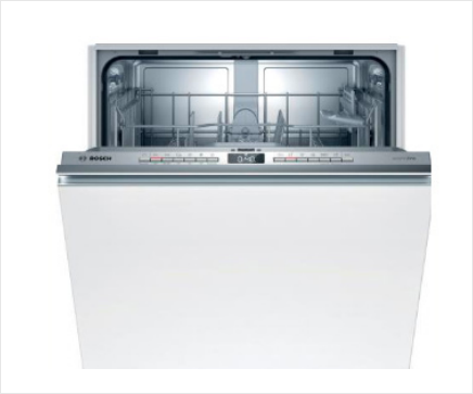
Vaatwasser Volledig geïntegreerd, geschikt voor 12 couverts, starttijdkeuze