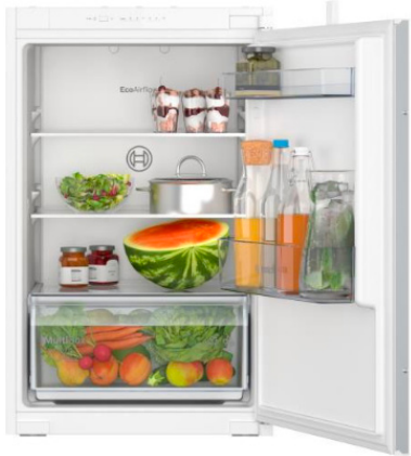
Koelkast Inhoud 136 liter, LED verlichting, glazen legplateaus