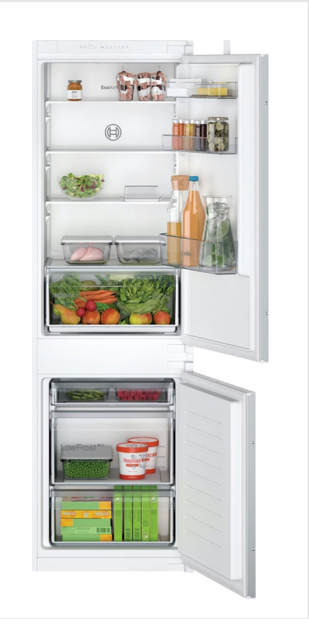
Koelkast Inhoud 183/84 liter, LED verlichting, glazen legplateaus